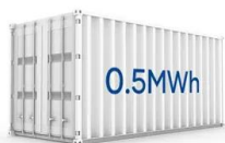
Standard 20ft containers